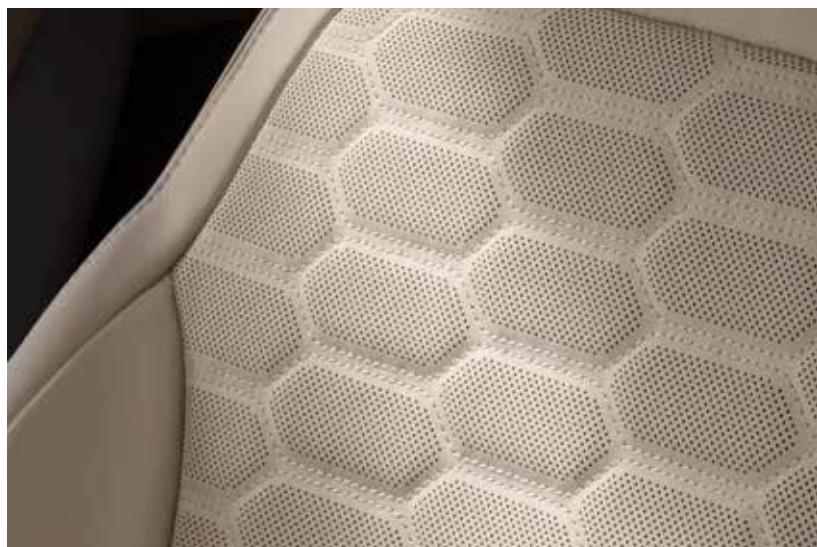
Tapicerka skórzana, perforowana Lux (jasna)