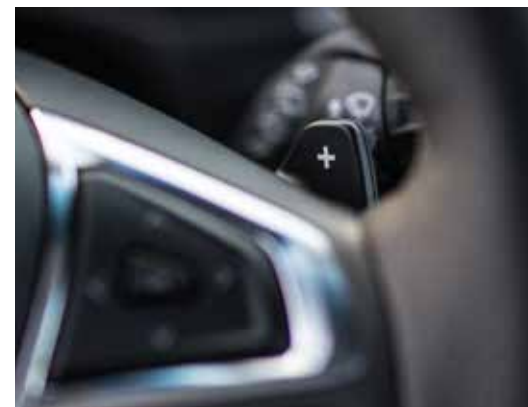
Manetki do zmiany biegów

Dostępne z automatyczną skrzynią biegów manetki przy kierownicy umożliwiają samodzielną zmianę biegów.