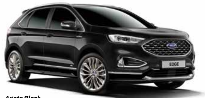
Agate Black Lakier metalizowany bez dopłaty