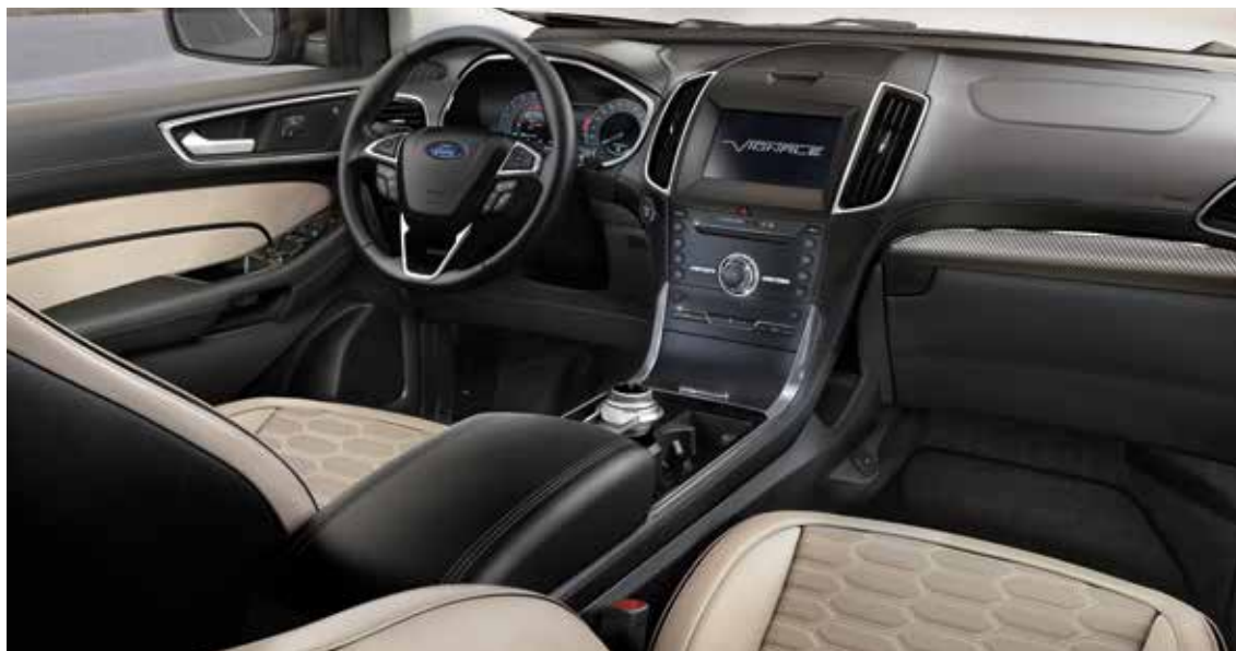
Nowy Ford Edge Vignale z tapicerką skórzaną, perforowaną Lux w tonacji Cashmere