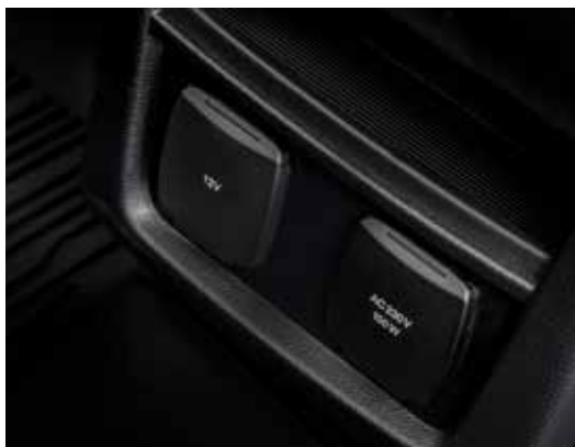
Gniazdko 230V umożliwia korzystanie z urządzeń elektronicznych, takich jak np. laptop w czasie podróży, bez obawy o rozładowanie baterii.

Opcja usuwa relingi z wyposażenia standardowego