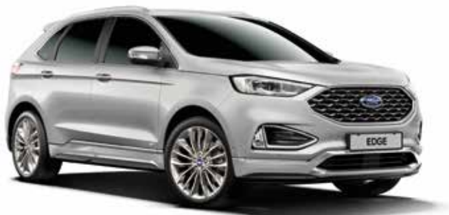
Ingot Silver Lakier metalizowany bez dopłaty