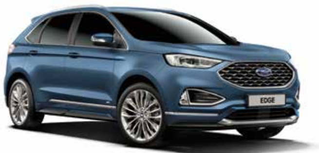
Chrome Blue Lakier metalizowany bez dopłaty