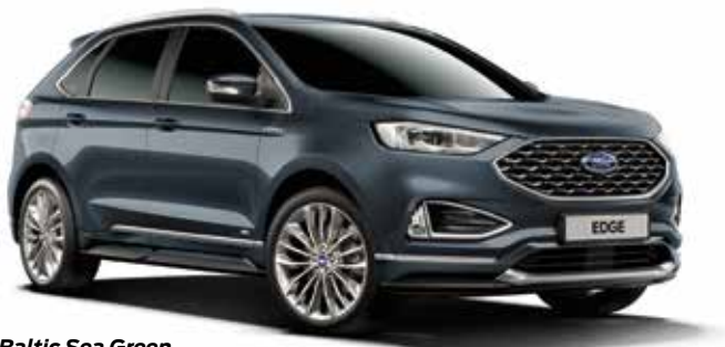
Baltic Sea Green Lakier metalizowany bez dopłaty