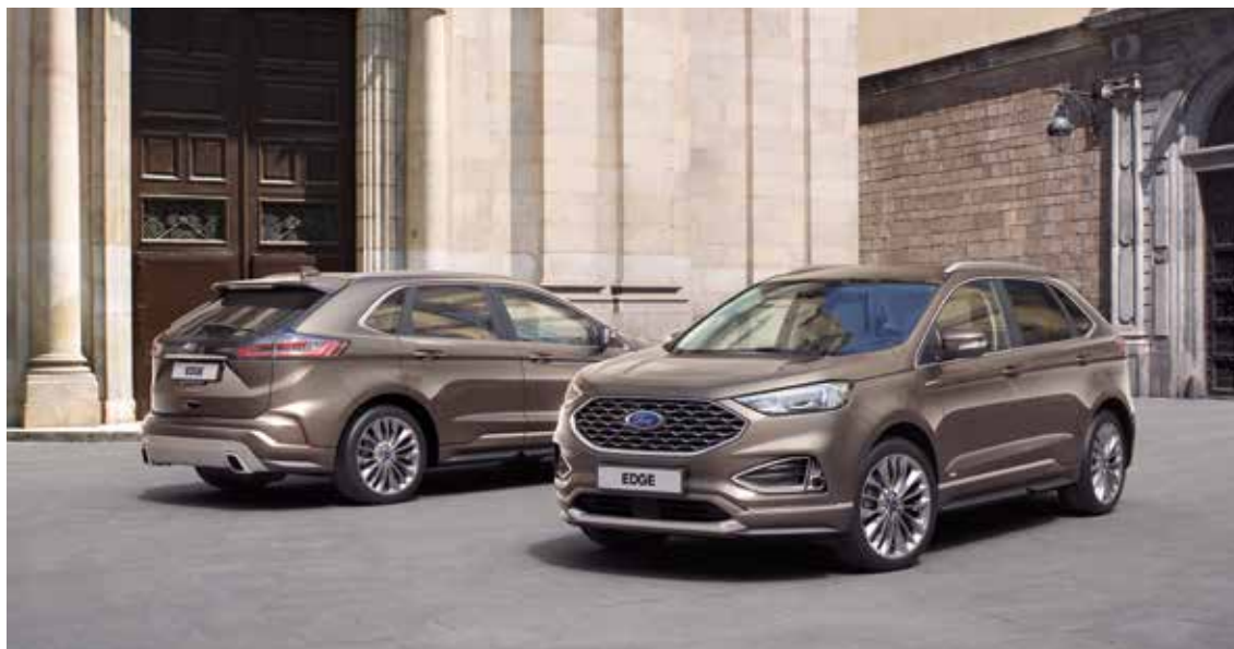
Nowy Ford Edge Vignale w kolorze Stone Grey (opcja) z 20" obręczami kół ze stopów lekkich