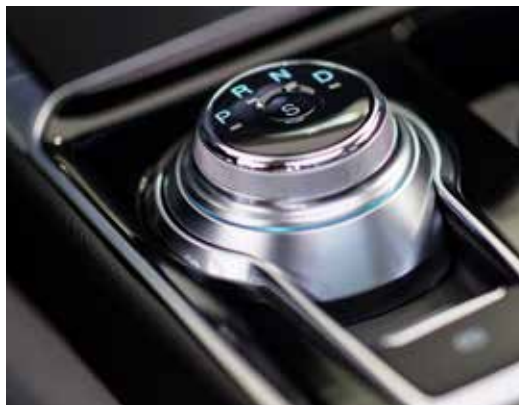
E-shifter - pokrętko sterowania automatyczną skrzynią biegów umożliwia szybkie i łatwe wybieranie trybów przekładni poprzez jego obrócenie