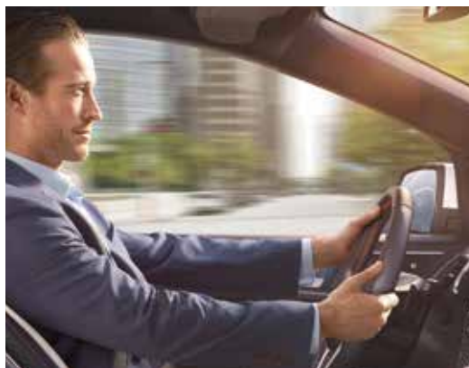
Układ Active Noise Control

Układ niweluje niepożądane hałasy w kabinie. Trzy ukryte mikrofony wychwytyją hałas w tle, który jest następnie tłumiony za pomocą odwróconych fal dźwiękowych emitowanych przez głośniki systemu audio.