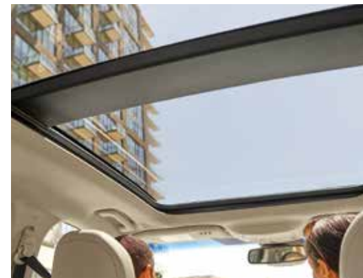
Dach panoramiczny otwierany , z roletą przeciwstónczną sterowaną elektrycznie oraz filtrem przeciwstóncznym IR