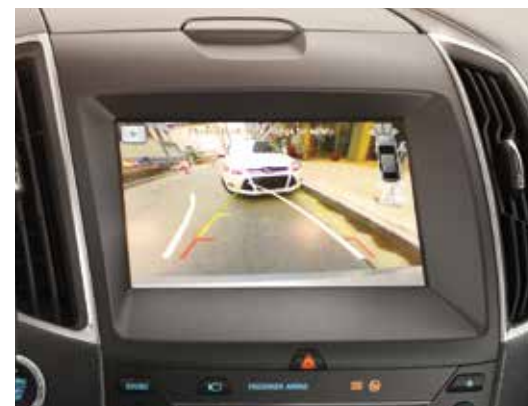
Kamera ułatwiająca parkowanie tyłem ze spryskiwaczem Standard

□ wyposażenie dostępne tylko w pakiecie lub z inną opcją