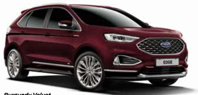
Burgundy Velvet Lakier metalizowany specjalny 800,-