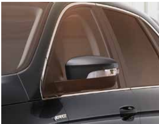
Lusterka boczne sterowane, podgrzewane i składane elektrycznie