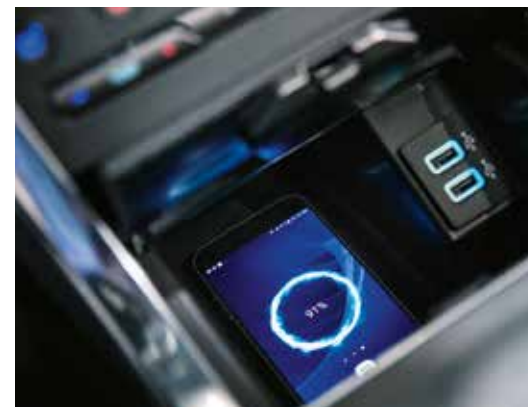
Ładowarka bezprzewodowa umożliwia ładowanie kompatybilnych urządzeń bez użycia przewodu Standard