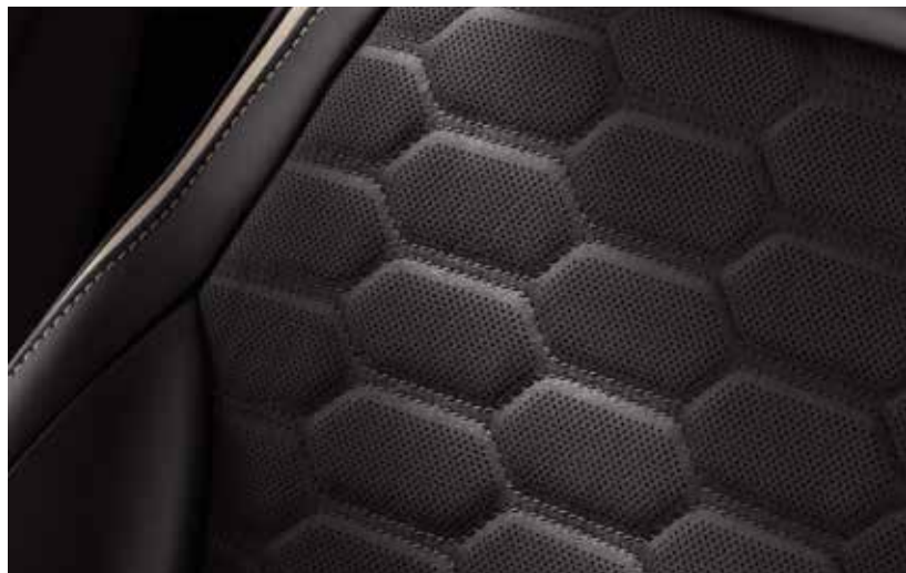
Tapicerka skórzana, perforowana Lux (ciemna)

□ wyposażenie dostępne tylko w pakiecie lub z inną opcją