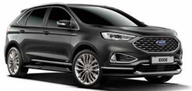
Magnetic Grey Lakier metalizowany bez dopłaty